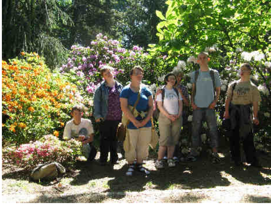
Przy pięknej pogodzie zwiedziliśmy cały kórnicki ogród.